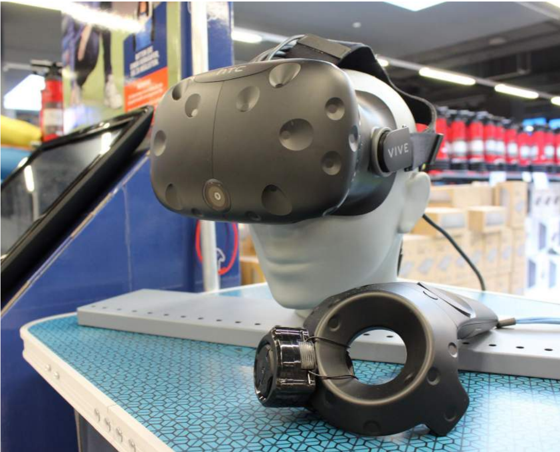
Virtual Reality Projekt in Berlin