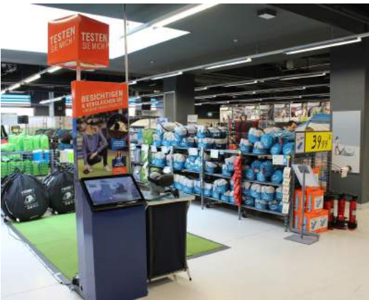
3D Erlebnis beim Einkauf